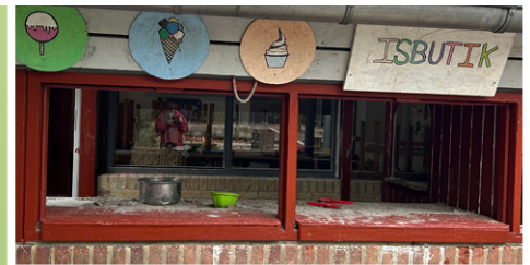
Is til salg